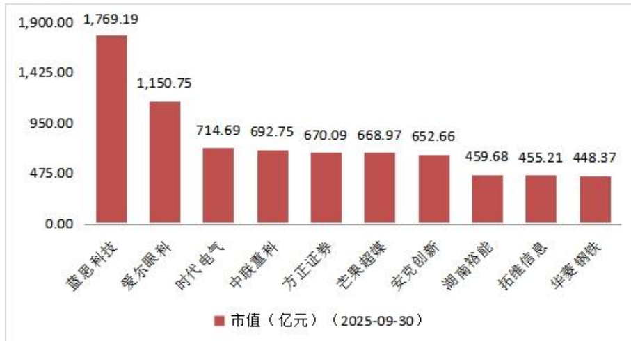
图 3 月成交额排名前十的上市公司