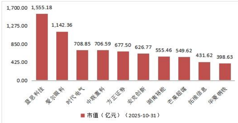
图3 月成交额排名前十的上市公司