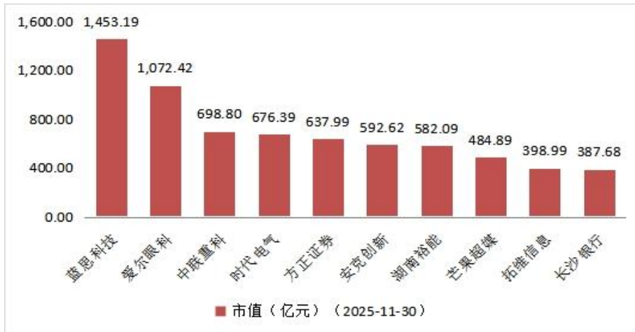
图3 月成交额排名前十的上市公司