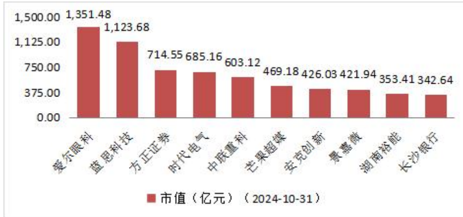
图3 月成交额排名前十的上市公司