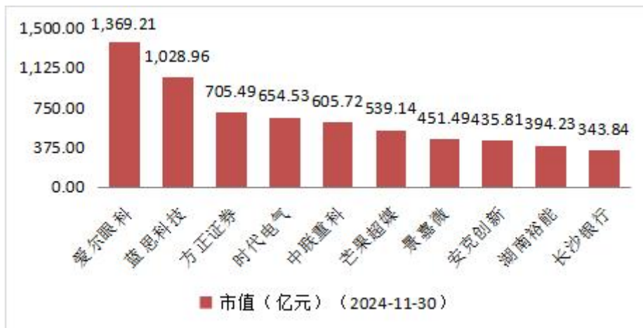
图3 月成交额排名前十的上市公司